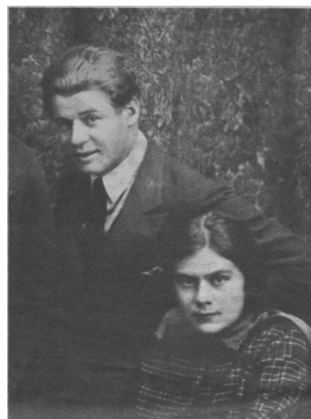
Сергей Есенин и Софья Толстая